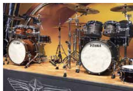
ショウプースの展示